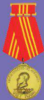
HUÂN CHƯƠNG HỒ CHÍ MINH