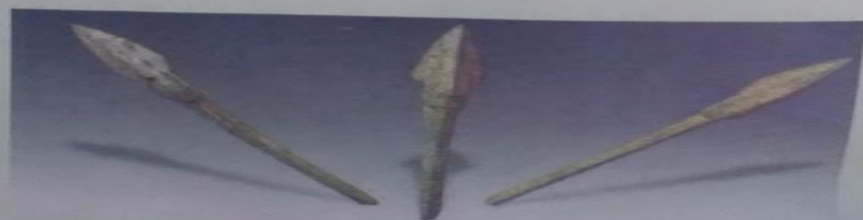
▲ Hình 4. Lẫy nỏ và mũi tên đồng được tìm thấy ở Cổ Loa