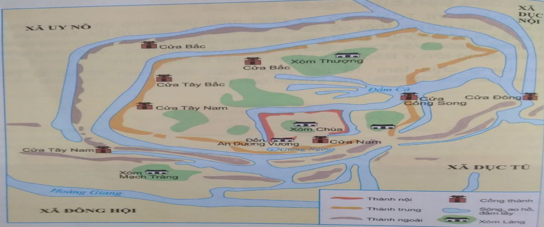
▲ Hình 3. Sơ đồ thành Cổ Loa – được xây dựng theo hình xoắn tròn ốc, có ba vòng khép kín với tổng chiều dài là 16 000m