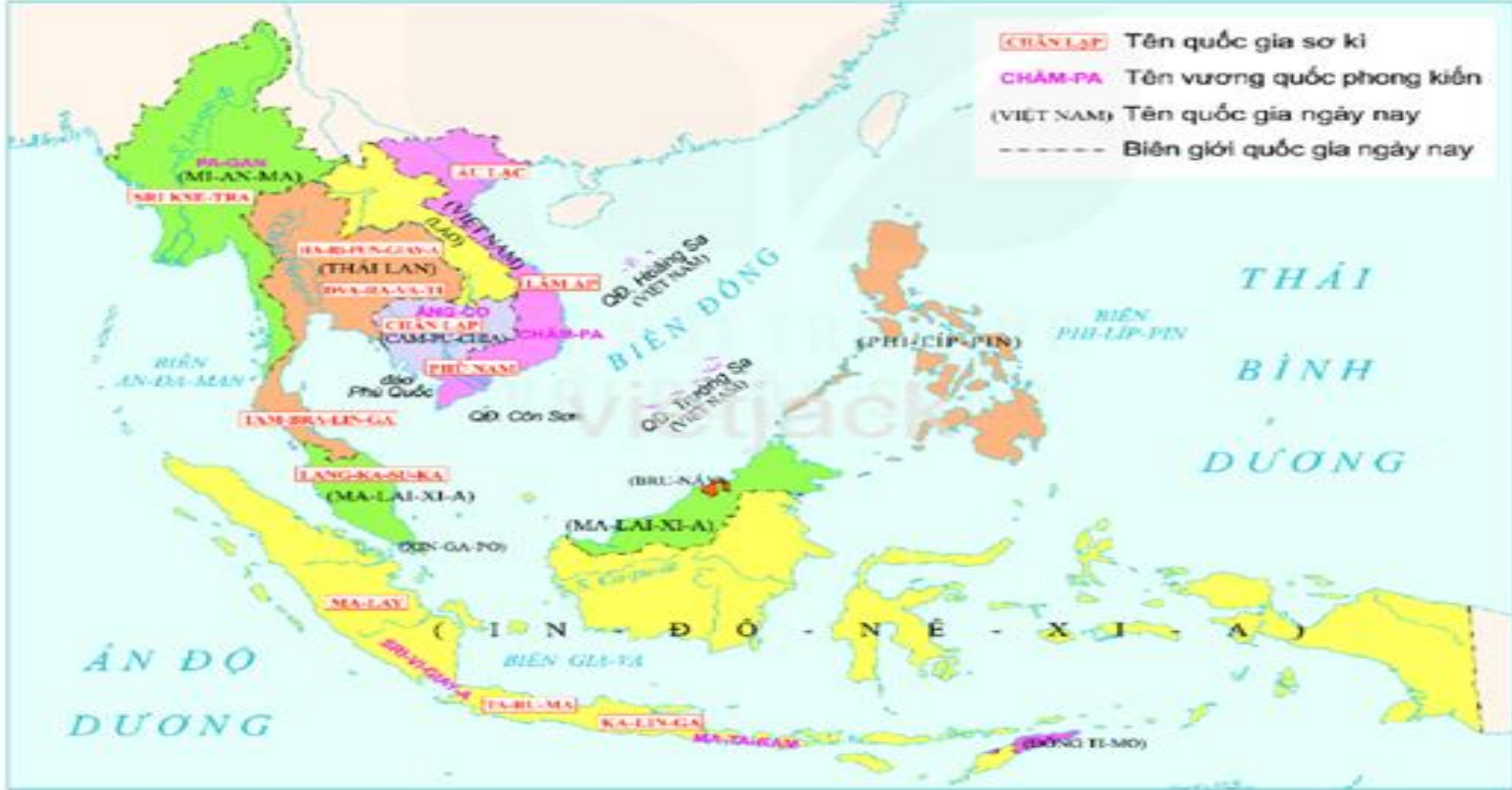
▲ Hình 1. Lược đồ các quốc gia sơ kì và phong kiến ở Đông Nam Á