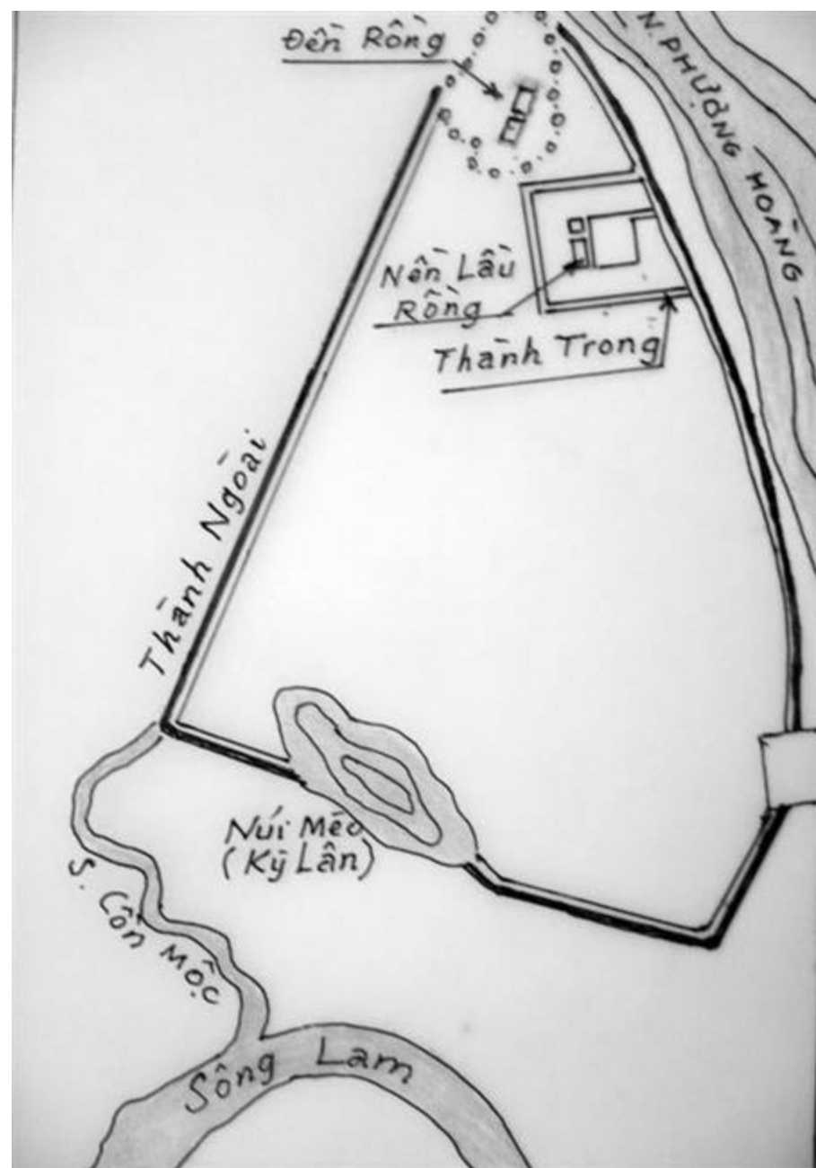
Hình 2 - Bản đồ Phụng Hoàng Trung Đô do Phan Duy Kha biên vẽ lại từ ảnh hàng không.